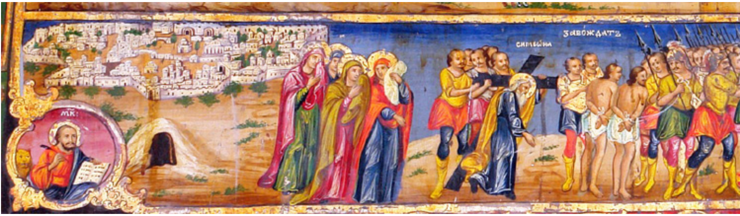
Сл.3. Композиции: Го водат Христос на распетие(лево) и Пронаоѓање на Чесниот крст (десно), Ерусалим, 1870 година (детал)