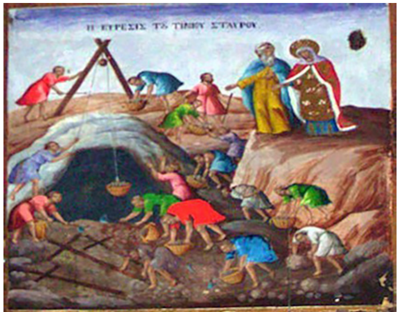
Сл.5. Пронаоѓање на Чесниот крст / фрагмент од икона, XIX век, непознат сликар, Ерусалимска патријаршија

под вратот. На главата има круна која во горниот крај се проширува, а под неа носи бел превез што се спушта до рамената. Иако царицата кога престојувала во Ерусалим била на осумдесетгодишна возраст 27 , зографот ѝ дал лик на млада жена со прекрасни физиономски карактеристики. Таа е претставена во тричетвртински став, со рацете покажува кон отворената пештера.