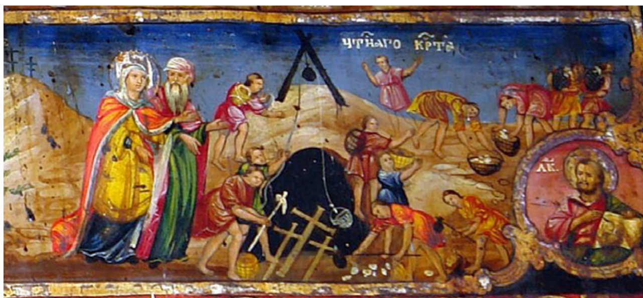
Сл.4. Пронаоѓање на Чесниот крст, Ерусалим, 1870 година (детал)

на презентација во повеќе епизоди. Имено, таа била информирана дека постарите луѓе во Ерусалим го знаат местото каде што е скриен крстот на кој е распнат Исус Христос. Во легендата главна личност е старецот Јуда, кој одбил да ја каже вистината, по што царицата го казнила и бил фрлен во длабок ров. Јуда бил единствениот што знаел дека вистинскиот крст Христов се наоѓа под храмот на божицата Венера 22 .