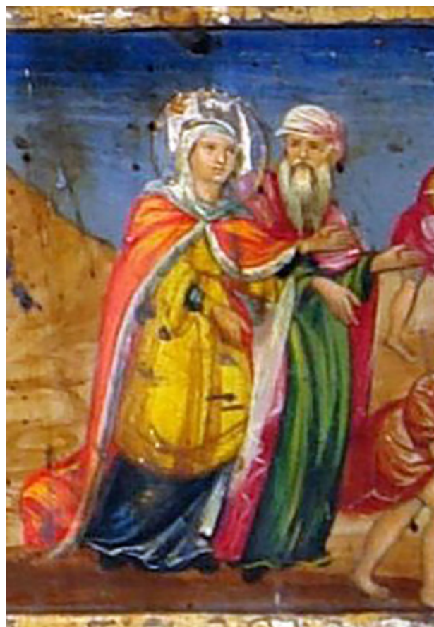
Сл.1. Царица Елена и епископ Макариј, фрагмент од композицијата Пронаоѓање на Чесниот крст, икона на платно „Ерусалим“, зограф Дмитриј, Ерусалим, 1870 година

Со нејзиното пристигнување во Палестина во 326 година, поклоничките патувања се официјализирани 10 . Царската програма била, да ги промо-