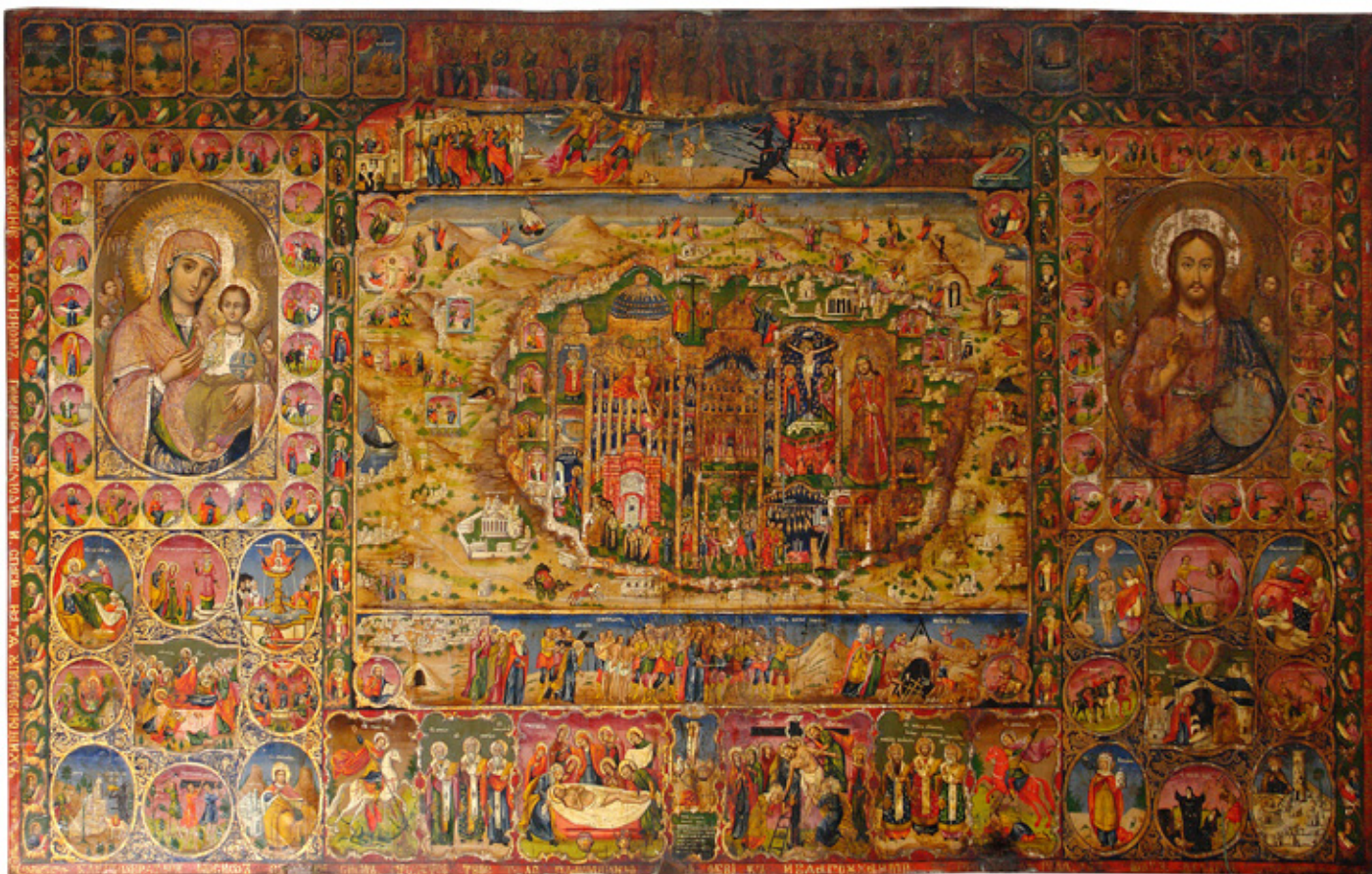
Сл.2.Ерусалим, темпера на платно, автор Дмитриј, Ерусалим, Палестина, 1870 година, црква Св. Благовештение, Прилеп

Овие зданија биле изградени од државни средства. По наредба на царот Константин, епископот Макариј ги спровел ископувањата во Ерусалим, кои го вратиле на површина гробот “признаен како Христов”. По целосното отстранување на камениот ѕид го крунисале со кружна црква наречена Ротонда на Анастасисот (Воскресението) во чија средина се наоѓала едикула опкружена со решетки наречена пештера на гробот. Блиското ритче на Голгота било споено и вметнато во портик на големиот атриум со кој се комуницирало со петбродната базилика Мартирионот (Сведоштво). Архитектот Зенобиус ги разграничил најважните свети места Голгота и Гробот, односно христијанската историја (Мартирионот) од христијанската вистина (Воскресението) 13 . Детален опис на Константиновата градба уште во IV